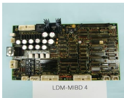
品番 MI-003 日立 B89インバーター(1994.9) 基板名 LDM-MIBD 4 取付部 カゴ上 用途 ドア制御マイコン 新品単価 ¥165,000