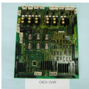
品番 MI-002 基板名 INV2-ICBD 取付部 制御盤 用途 インバーター駆動回路含む 主トランジスタ、回生トランジスタのベース信号